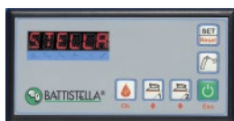
CONSOLE COMANDI CONTROL PANEL