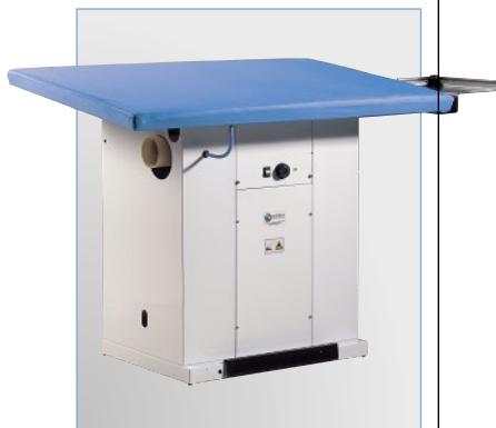
Piano stiro inclinato Tilted ironing board

RECTANGULAR VACUUM (OR VACUUM AND BLOWING) IRONING BOARD WITH BOILER